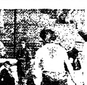
وزير الصحة شوستاك في زيارة الى باقة الغربية.

الناصرة - ارسلنا - من مجلس باقة الغربية مواطنة شرقية، الى السيد اليعيزر شوستاك وزير الصحة تقديراً من المجلس المحلي للجهود التي يبذلها الوزير من اجل تحسين وتطوير الخدمات الصحية في الوسط العربي والخاص بالمركز الصحي في قرية باقة الغربية.